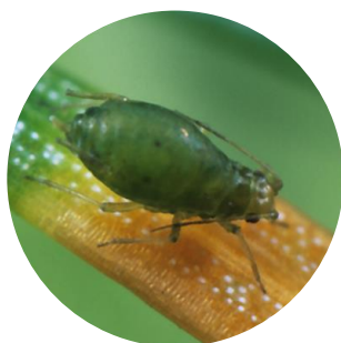
P. Chaubet © INRAE